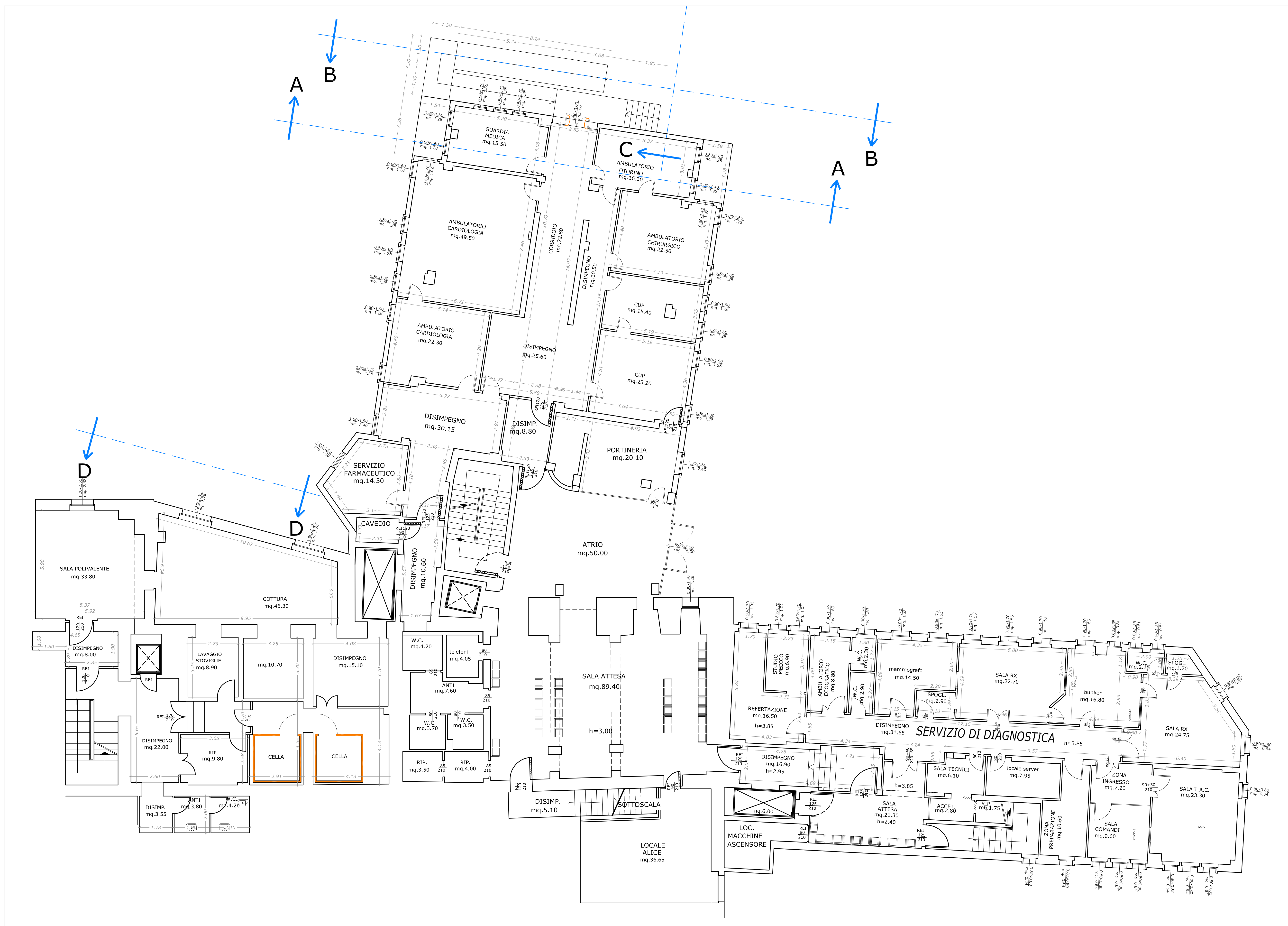
PIANTA PIANO PRIMO SEMINTERRATO - SCALA 1:100