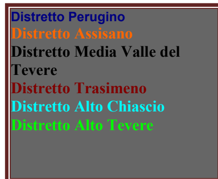
figura 2 Distretti