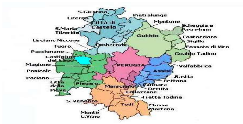
F. 1 – Comuni USL Umbria 1

L'Azienda USL Umbria n.1, ai sensi e per gli effetti dell'art. 3 comma 1-bis del D. L.gs. n. 502/92, ha personalità giuridica pubblica ed autonomia imprenditoriale.